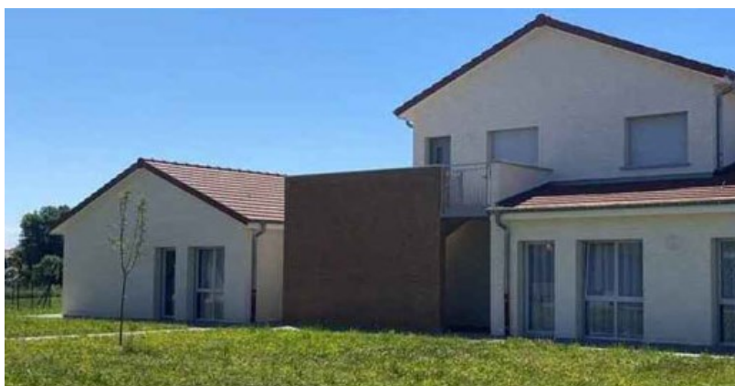
Un exemple de construction Ages & Vie

Un projet qui devrait être finalisé début 2022, après enregistrement des informations auprès de l'ATD et pose des différentes plaques.