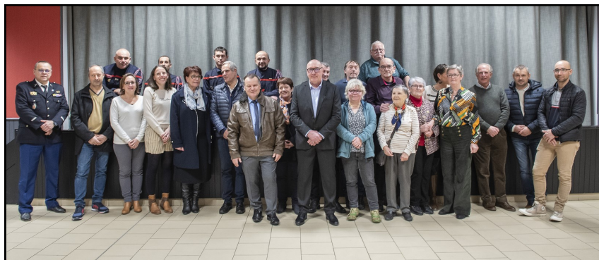
Cérémonie des vœux 2025 - ©Photo Christian Burg

Les autres projets dont je vous parle déjà depuis quelques temps arrivent : construction du tennis et des tennis padel couverts par des panneaux photovoltaïques, installation de la vidéoprotection, rénovation de la place Polony, construction de la médiathèque.