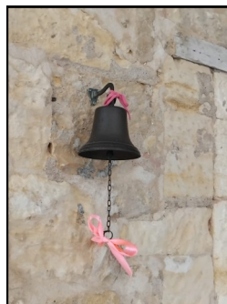
Photos récompensées lors du concours - à gauche, celle réalisée par Tess ; ci-dessous, celle prise par Gabriel

Ce week-end s'est clôturé par la venue de Daniel Chavaroché et ses « Racontades ».